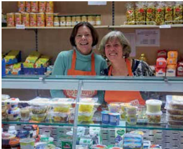
Stets ein Lächeln auf den Lippen: Zwei ehrenamtliche Frauen beim Verkauf im Tafelladen.

Einkaufen kann, wer eine Kundenkarte besitzt. Sie ist für Menschen mit geringem Einkommen erhältlich im Tafelladen und in allen Tafeln im Main-Tauber-Kreis gültig. Die Beratungsstellen von Diakonischem Werk, Caritasverband, das DRK und die Sozialämter überprüfen, wer zum Einkauf berechtigt ist und stellen den entsprechenden Berechtigungsschein für die Kundenkarten aus.