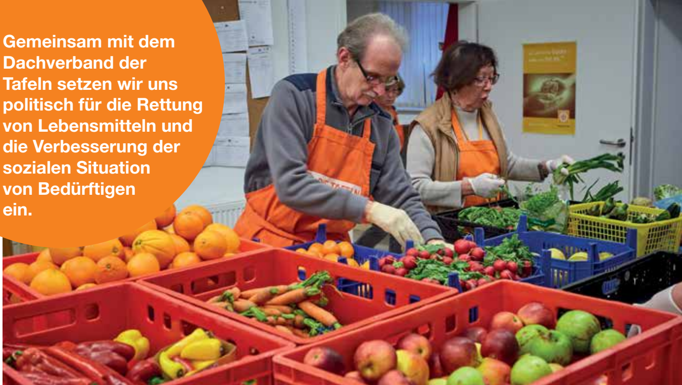
Mitarbeitende der Tafel beim Vorsortieren der eingehenden Waren.

Gemeinsam mit dem Dachverband der Tafeln setzen wir uns politisch für die Rettung von Lebensmitteln und die Verbesserung der sozialen Situation von Bedürftigen ein.